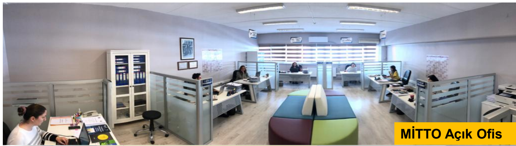
MİTTO Açık Ofis