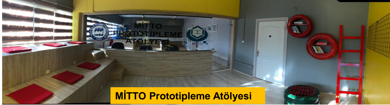
MİTTO Prototipleme Atölyesi