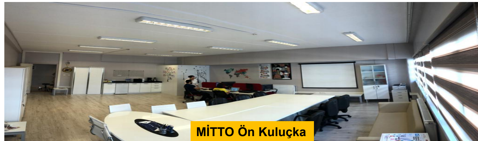
MİTTO Ön Kuluçka

Marmara Üniversitesi, Göztepe Yerleşkesi, İbrahim Üzümcü Binası, 2. kat.